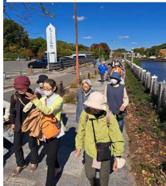
「七里の渡し」に向けてラストスパート