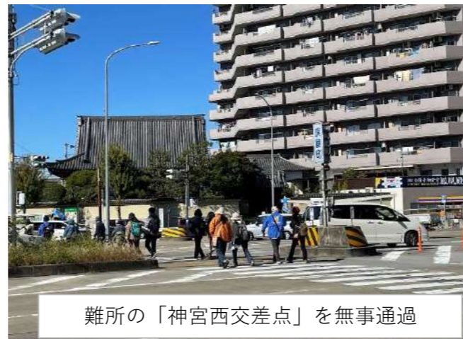
難所の「神宮西交差点」を無事通過