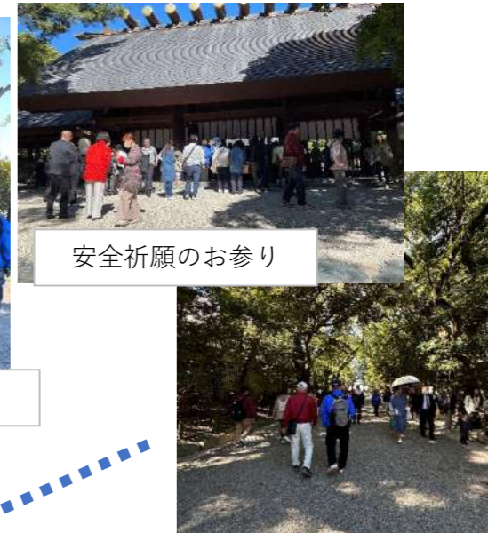
安全祈願のお参り