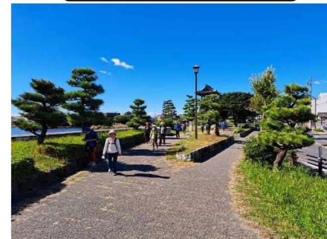
とーちゃーく 無事 完歩！