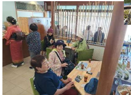
ちょっと休憩。 「あな、何歩歩いた？」