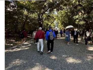
神宮の杜から出発