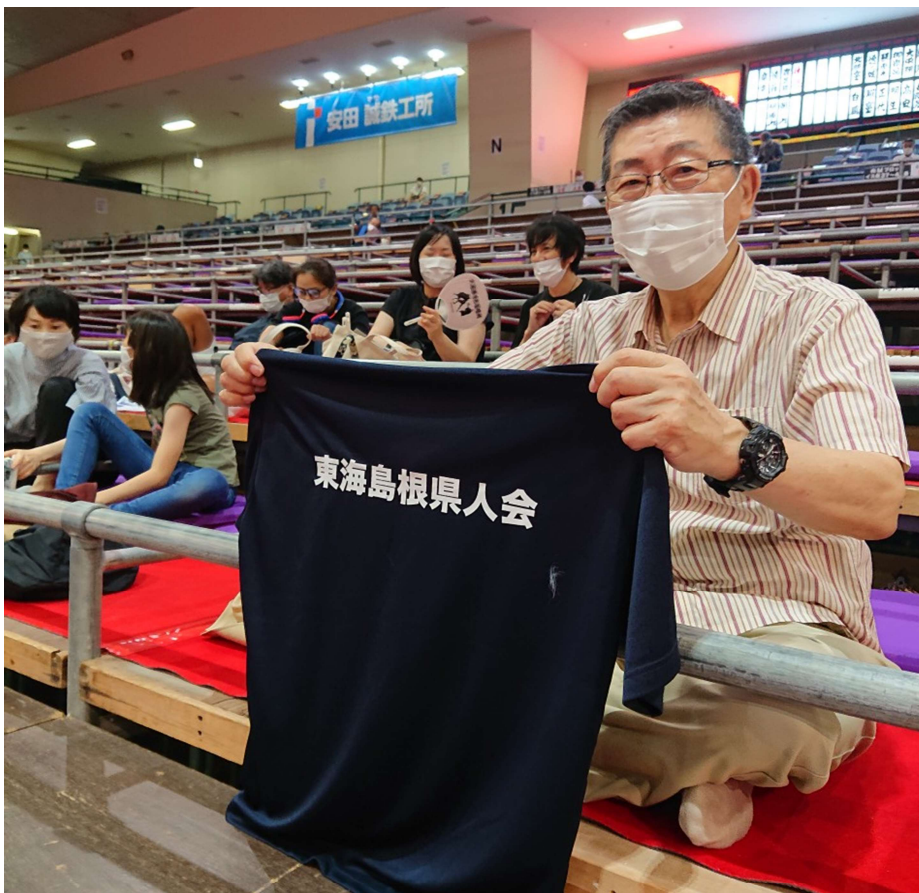
“東海島根県人会”のロゴ入りポロシャツをかざして応援する 桂会長