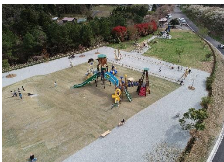
ドローンより、空からの風景

*公園内には、大型遊具、複合遊具、幼児用遊具、屋外休憩所などが設置されています。駐車場もあり、アクセスしやすくなっているため、休日にはたくさんの親子連れの利用があり、賑わっています。