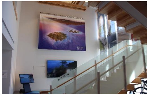
ジオパーク紹介エリア