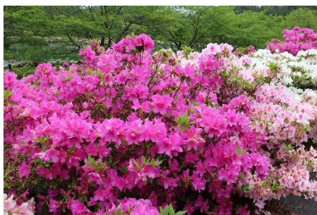
都万 亀の原 水鳥公園

○現在、ツツジ・アヤメの花が見ごろを迎えております。5月～6月はツツジ・アヤメ・アジサイが季節を彩ります。