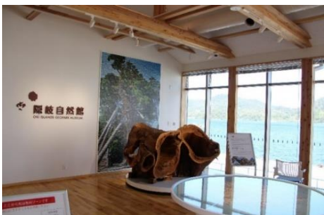
2階 隠岐自然館入り口

○ 2階には、従来隠岐ポートプラザにて開設しておりました隠岐自然館が、当施設の2階へ移動し、隠岐ユネスコ世界ジオパークの特色や魅力を展示する施設として、さらにパワーアップし、新しい隠岐自然館として開館しております。