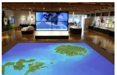
プロジェクションマッピング